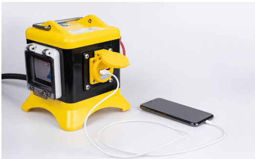
Integroituu täydellisesti esim. BALS Uni-Blockiin

Suosittellemme 1A etusulakkeen asentamista. Esim. G-tyyppi 5x20mm lasiputkisolake din-kiskolle tai paneeliin tai lattasulakepidikeellä